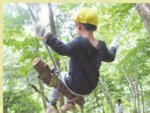
学校林を持っているのは 大津市では比叡平小だけ！