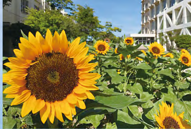
地域の方、先生、保護者で畝を作った小学校のひまわり畑