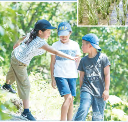
青い鳥の谷で遊ぶ子ども達

「子育てするのに最高の場所！」という声が山中比叡平在住の保護者からよく聞かれます。 え？山の上で不便じゃないの？と思いますよね。なぜ最高なのか、少し紹介させていただきます。