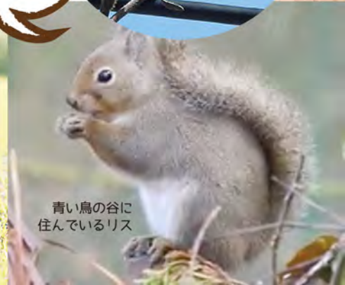
青い鳥の谷に住んでいるリス