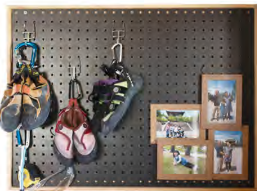
家族全員の趣味のウォールクライミング用の靴。リビングに腕の力をつけるための練習用ロープがぶら下がっています！

U / 里山の「青い鳥の谷」など、コミュニティの方が自然を活かした取り組みを本当にたくさんされているので、こともたちと一緒に「外遊び」をもっと上手にしたいなって考えています。そこには、鳥だけじゃなく、野生のリスやカブトムシもたくさんいるみたいなので。また、主人も私も子どもも山登りが好きなので、今度庭にクライミング・ウォールを作ろうと計画中です。あとは、家族みんなトランペットなどの楽器を演奏するんですけど、以前と違って家で思いつき練習ができるのでそういう時間も増やしたいですね。いろいろな特技を持った人がたくさん住んでいるので、このコミュニティの資源を最大限活用したいなって思っています。