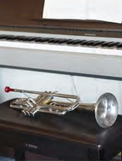
娘さんの練習用トランペット。家族で音楽を楽しんでいます。

とで子どもを怒ることが減って、その分私たちも穏やかに子供に接することができるようになったことも嬉しいですね。 また、マンションだとなかなかDIYができませんが、「自分たちで手を加えられる余地」が本当にたくさんあって、「次は何を庭に植えようか？次は何を作ろうか？」と家族で考えられる毎日が幸せです。比叡平は土地も安く、庭も広く取れるので、そうしたことが可能なところが魅力ですね。