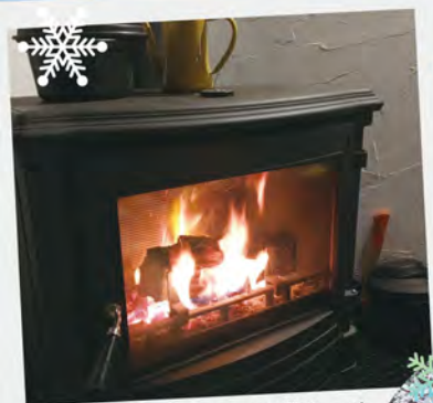
薪ストーブの周りにみんな集まって過ごすのは冬のたのしみ。