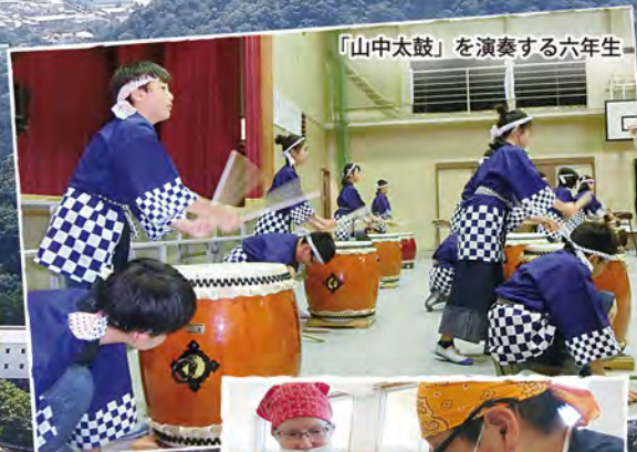
「山中太鼓」を演奏する六年生