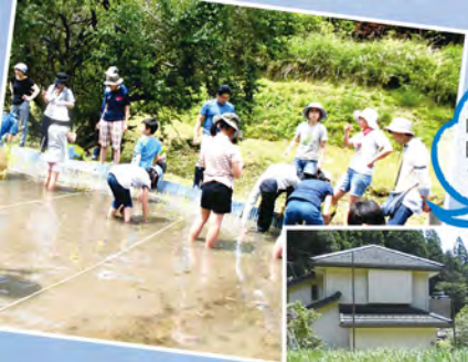
山中町の田んぼで 田植え体験を させていただきました。