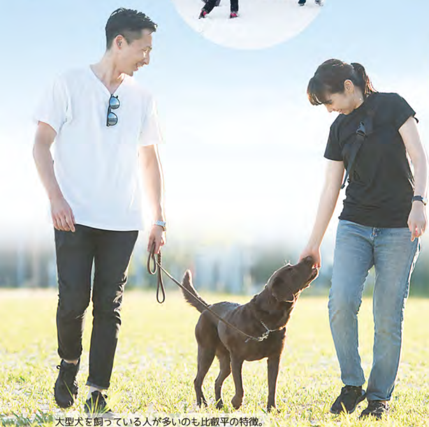
大型犬を飼っている人が多いのも比叡平の特徴。