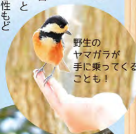
野生のヤマガラが手に乗ってくることも！